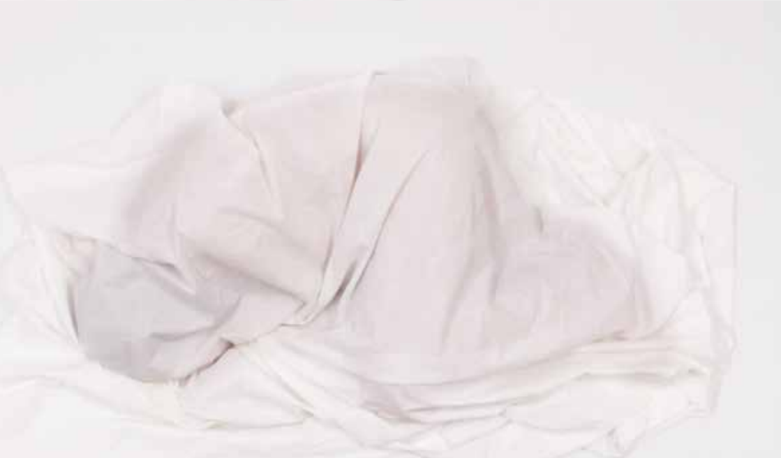
Justyna Olszewska, Powłoka , video performance

Siła artystycznego eksperymentu w przypadku twórczości omawianych artystów wynika z uniwersalności pojęć i doświadczeń, do których odnoszą się podejmowane przez nich działania.